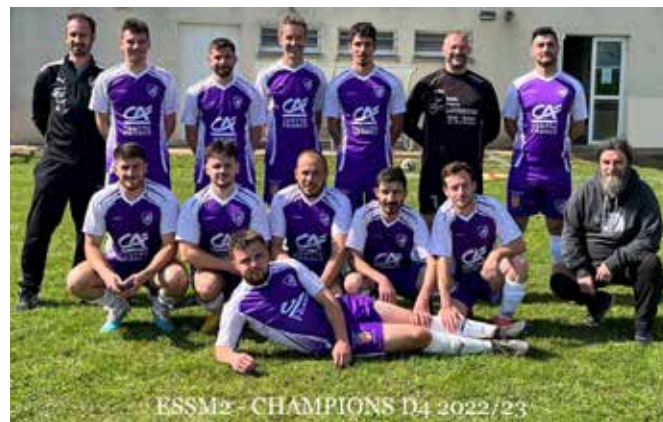
ESSM2 - CHAMPIONS D4 2022/23

L'équipe 3 : avec un effectif très changeant chaque week-end selon la disponibilité des joueurs, les résultats sont variables avec 3V/1N/3D et un forfait après 8 matchs disputés.