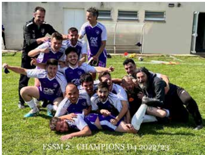
ESSM 2 - CHAMPIONS D4 2022/23