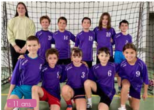
- 11 ans