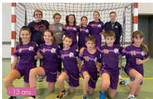
- 13 ans