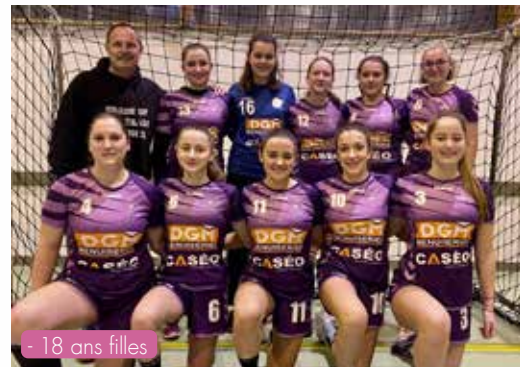
- 18 ans filles