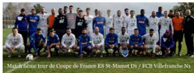
Match 6ème tour de Coupe de France ES St-Mamet D1 / FCB Villefranche N1