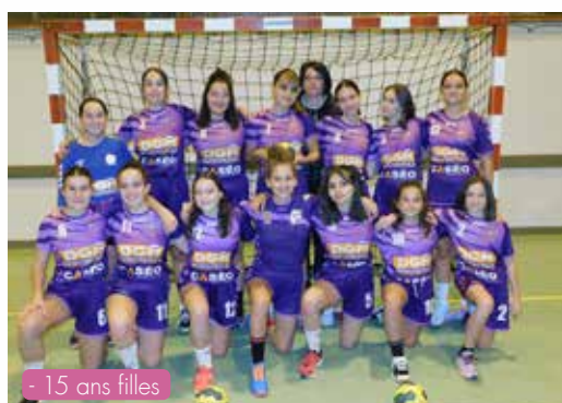
- 15 ans filles